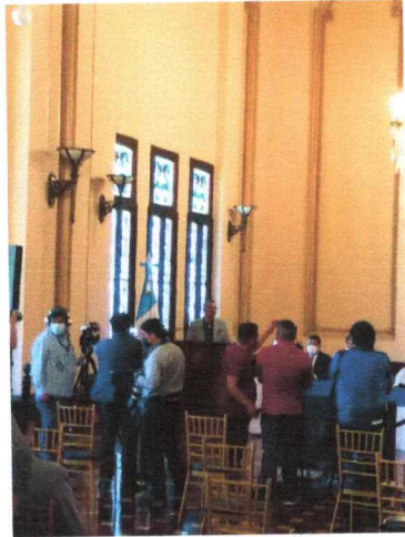
Conferencia de Prensa, Registro Único Nacional de Artistas