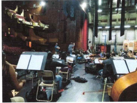
Ensayos de la Ópera Kíche Winak, Pueblo Kiche

Se le ha dado seguimiento y acompañamiento a la Opera Quiche Winaq, que como bien sabemos, por diversas razones ha recalendarizado sus ensayos y presentaciones.