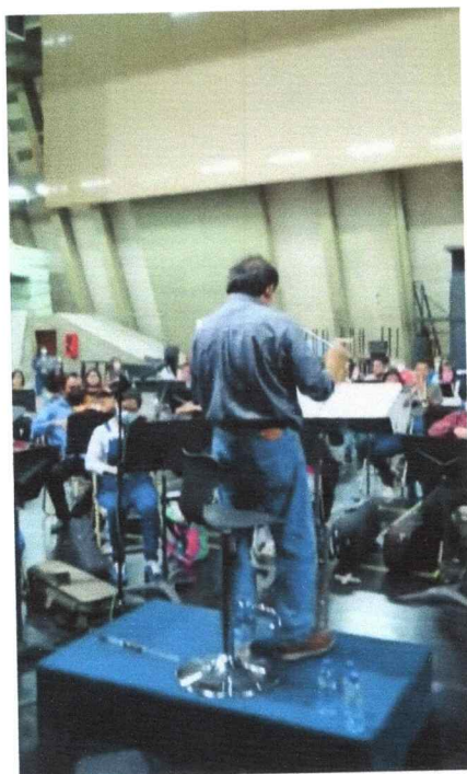
Ensayos de la Opéra Kíche Winaq, Pueblo Kiche

4) . Acompañamiento a la producción de la Opera Quiche Winaq